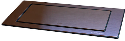
SUPPORT DE PRISE VERSO COPPER A000 A18